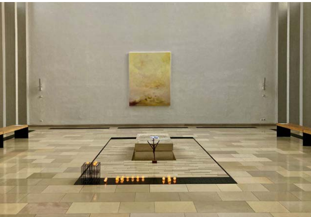
„Himmel – Reich der Ewigkeit“, großformatiges Gemälde der Künstlerin Annette Zumkley

■ Unter dem Titel „Viele Bruchstücke – ein Bild“ wurden hier Architektur, archäologische Funde, historische Fotografie mit moderner und spiritueller Kunst zusammengeführt und zu einem Gesamtbild miteinander verbunden. Was auf den ersten Blick unterschiedlich erschien, fügte sich zu einer eindrucksvollen Gesamtschau zusammen. Initiiert wurde das Projekt vom Förderverein für Kunst und Kultur e. V., dem Heimatverein Dülmen e. V. und dem Emmerick-Bund e. V. Ihr gemeinsames Anliegen: einladen zum Schauen, Staunen und Nachdenken und vielleicht Dinge in einem neuen Licht zu sehen.