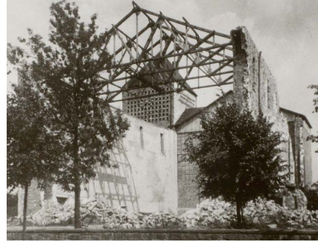
Zerstörung der Kreuzkirche im Zweiten Weltkrieg

Ein weiterer Baustein der Ausstellung war in der Unterkirche eine Fotoprojektion, die Erik Potthoff vom Heimatverein konzipiert hatte. In selten zu sehenden Bildern zeigte sie Wandel, Zerstörung und Wiederaufbau der