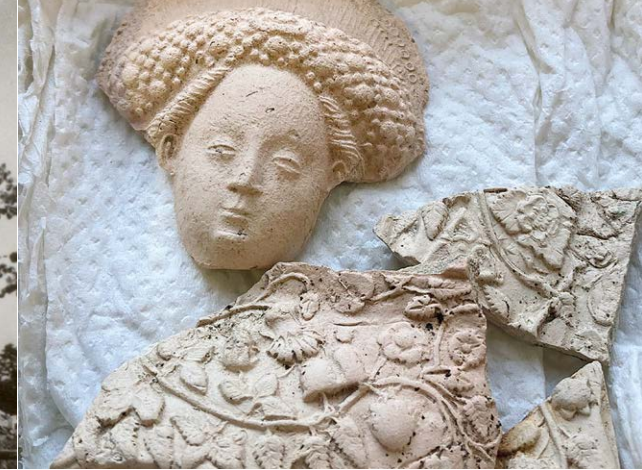
Bruchstücke Andachtsbild aus dem Kloster Agnetenberg

Anschaulich ergänzt wurde die Präsentation durch Vergleichsobjekte – wertvolle Leihgaben von der LWL-Archäologie für Westfalen, dem Hetjens Keramikmuseum Düsseldorf, der Stadtarchäologie der Städte Münster und Soest sowie dem LWL-Landesmuseum für Klosterkultur Stiftung Kloster Dalheim. Sie machten