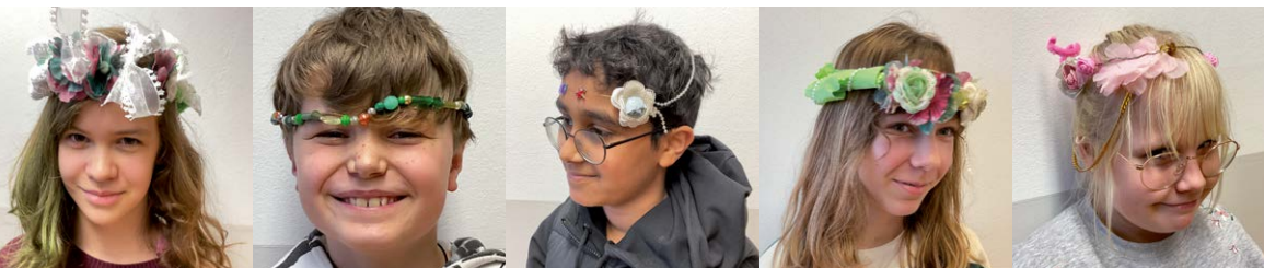
Schüler*innen der Picasso-AG der Hermann-Leser-Schule bildeten nach historischen Vorbildern Totenkronen nach.

Die Ausstellung war ein Gemeinschaftswerk, das ohne die Offenheit der Kirchengemeinde und die Zustimmung und Unterstützung durch die kirchlichen Gremien und Mitarbeiter, ohne Sponsoren, Leihgeber, ehrenamtliche Helferinnen und Helfer sowie das Gedenkstätten-Team nicht möglich gewesen wäre. Schön, dass so viele zu diesem Erfolg beigetragen haben. Ganz herzlichen Dank dafür! Am Ende bleibt das Bild einer Ausstellung, die gezeigt hat: Geschichte, Kunst und Glaube sind keine getrennten Bereiche. Sie sind wie Bruchstücke Teile eines größeren Ganzen – und wenn man sie zusammenführt, entsteht ein neues, leuchtendes Bild. | Angela Pund