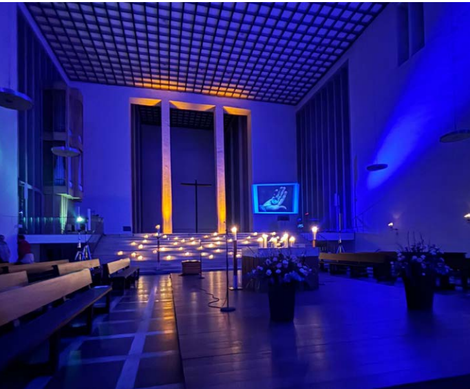
Firmvorbereitung beim „Time-Out“: Ein Stationslauf in der stimmungsvoll erleuchteten Kreuzkirche – eine Auszeit vom Alltag.

■ Jedes Jahr möchten ca. 50 bis 60 Jugendliche aus unserer Gemeinde zur Firmung gehen. Dafür braucht es jedoch eine Firmvorbereitung, inklusive Planung, Organisation und Durchführung. Das übernehmen wir – die Katechet*innenrunde aus Heilig Kreuz. Eine bunte Runde mit einer großen Portion Teamgeist, die gerne etwas bewegen möchte.